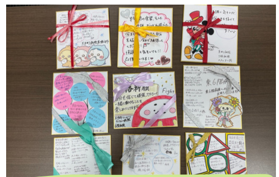
各病棟より激励色紙プレゼント